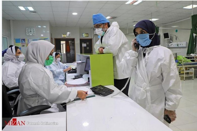
دبیر علمی بیستمین کنگره ارتقاء کیفیت خدمات آزمایشگاهی تشخیص پزشکی با تاکید بر نقش موثر آزمایشگاه‌های بالینی در ارائه خدمات بهداشتی و تشخیصی، گفت: امروزه از نشانگرهای زیستی در تشخیص زودهنگام طیف وسیعی از بیماری‌ها همچون سرطان، بیماری‌های قلبی-عروقی، بیماری‌های دستگاه گوارش، بیماری‌های حونی و تشخیص‌های قبل از تولد استفاده می‌شود.

۱۳ اسفند ۱۴۰۱ - ۱۷:۳۲:۰۹ کد خبر: ۴۷۰۱۷۵۴ دسته بندی: جامعه ، شهری، سلامت و رفاهی