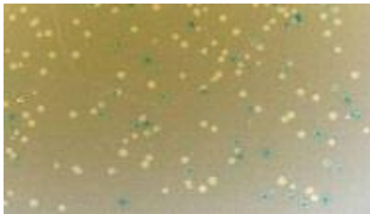
شکل ۲: کلونی های سفید رنگ حاوی پلاسمید نوترکیب

جهت تایید حضور ژن در کلون های انتخاب شده، از کلونی PCR با آغازگرهای اختصاصی استفاده شد. پس از تایید کلونینگ، برای بررسی تطابق توالی های به دست آمده از پلاسمید نوترکیب PTZ-RT با کروماتوگرام رسم شده، نتایج تعیین توالی با ژن رفرانس مقایسه شد و صحت بازهای آن ها کنترل گردید. برای تعیین ژنوتیپ ویروس، توالی های به دست آمده با ژن های رفرانس مرتب شده و برای صحت رسم درخت فیلوژنتیک رسم درخت ۱۰۰۰ بار تکرار شد (شکل ۳).