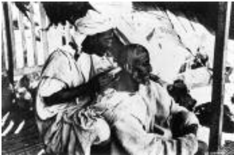
شکل ۴: حجامت در مراکش که از ظروف نقره برای جمع‌آوری خون استفاده شده است (۸).

گذشته و حتی حال استفاده کرده‌اند. افراد مورد مطالعه به ارتباط بین حجامت سنتی و خونگیری غربی (Western blood sampling) اشاره کردند. از نظر آنان خونگیری مدرن، سبب ایجاد نتیجه‌ای مشابه با حجامت می‌باشد و به همین جهت این بیماران به طور مکرر از پزشک خود درخواست انجام آزمایش می‌کنند.