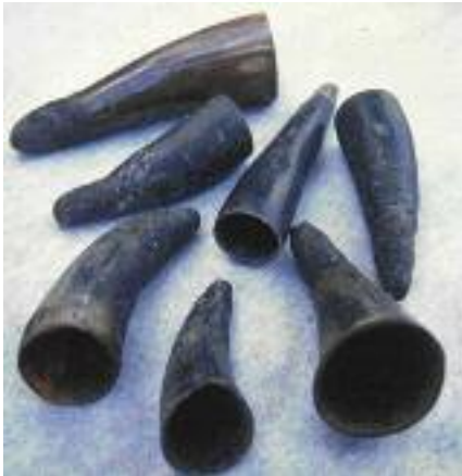
شکل ۸: شاخ حیوانات که برای حجامت استفاده می‌شد (۱۵).

ابتدا پوست تمیز می‌شد و شاخ گاو در محل مکش قرار می‌گرفت. دهانه شاخ محل مکیدن بود، سپس برای چند لحظه شاخ برداشته می‌شد و برش سطحی در محل ایجاد می‌شد. مجدداً شاخ گذاشته می‌شد و قسمت دهانه آن با شدت مکیده می‌شد. خون در شاخ انباشته گشته و زمانی که شاخ گاو از محل برداشته می‌شد، لخته‌های تیره خون به عنوان خون بد و کثیف به بیمار نشان داده می‌شد. سپس زخم به کمک پارچه خشک و آغشته به پودر گیاهی تمیز می‌شد (شکل ۸) (۱۵).