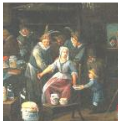
شکل ۳: جراحان در حال حجامت، اواخر قرن ۱۷ (۸)

درمان پر خونی [Plethora] احتمالاً پلی‌سایتمی [ در پاتولوژی دوران باستان همانند مجموعه قوانین شرعی و عرفی یهودیان بابلی (Talmud)، نقش بسیار مهمی داشته است. در آیین یهود، پزشکان به عنوان دانشمند و حجامت کنندگان به عنوان هنرمند شناخته می‌شدند. البته در همه نوشته‌های یهودیان، حجامت مورد تایید نیست، در انجیل نیز بریدن پوست کاملاً منع شده است (۱۱).