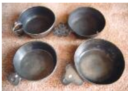
شکل ۲: نمایی از ظروف جمع‌آوری خون در حجامت (۱۸۵۰-۱۷۷۰) (۱۰)

در اواسط قرن ۱۸ به نظر می‌رسد که گرفتن خون روش استاندارد برای درمان تب به حساب می‌آمده، هر چند که این روش برای درمان تب‌های عفونی مانند تیفوئید یا تیفوس کاربردی نداشته است (۸). خونگیری تا پرشدن یک لگن ادامه می‌یافت که تقریباً معادل ۲۰ اونس (۵۸۰ میلی‌لیتر) است و این میزان می‌توانست تا ۲۵ اونس (۷۲۰ میلی‌لیتر) ادامه یابد. اولین خونگیری تا زمانی که بیمار از حال برود (Faint) ادامه داشت (شکل ۲) (۹).