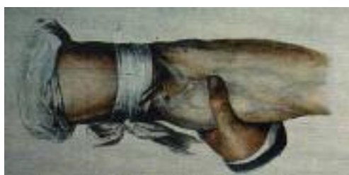
شکل ۷: خونگیری از ورید (۱۰)

ابزارهای به کار رفته شامل لانست و Fleam می‌باشند. لانست شستی کوچک با نوک تیز، ابزار جراحی است که برای فلوتومی انسان به کار می‌رفت. بازوی بیمار در بالای آرنج با یک نوار پارچه‌ای محکم بسته می‌شد تا ورید را فشار دهد. اما نه آن قدر محکم که نبض شریان را کاهش دهد. تیغه لانست بین شست و انگشت سبابه قرار می‌گرفت و دست با سه انگشت دیگر حمایت می‌شد. سپس لانست در یک جهت وارد ورید می‌شد تا خون از این نقطه بیرون آید. لبه فوقانی لانست در یک خط مستقیم کشیده می‌شد تا پوست را هم سایز ورید زخم کند.