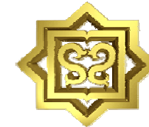
دانشگاه علوم پزشکی کرمان