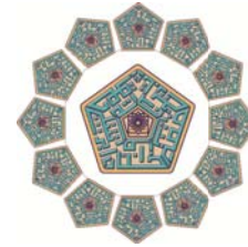
مرکز تحقیقات اخلاق و حقوق پزشکی ایران